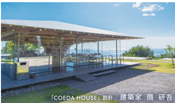
「COEDA HOUSE」設計 建築家 隈 研吾